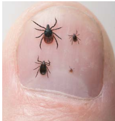
Een duimnagel met daarop vier teken.